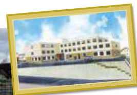
K様サ高住 愛知県碧南市 山神町一丁目47