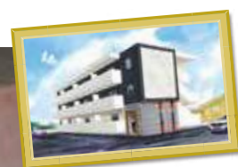
T様マンション 三重県鈴鹿市白子 本町3-9付近