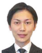
分譲マンション事業部 下田