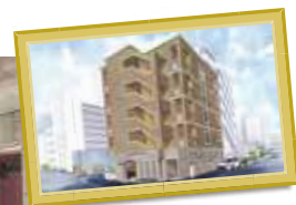
S様マンション 愛知県名古屋市北区 山田一丁目7-30付近