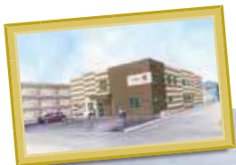
A様サ高住 岐阜県可児市土田5252