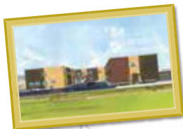
I様サ高住 岐阜県岐阜市西改田若宮71-3付近