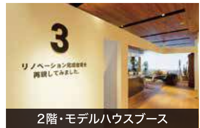
2階・モデルハウスブース

ゴールドトラスト株式会社 賃貸管理部は5月16日(木)に下記へ移転します。 「スマイシア」の1階にオープンします。電話・FAX番号の変更はございません。