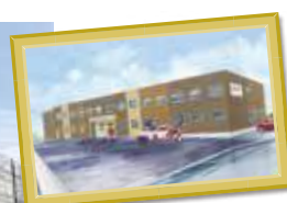
L様サ高住 岐阜県羽島市 竹鼻町狐穴 935付近