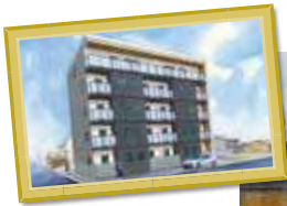
L様マンション 三重県四日市市 元町11-6付近