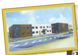
S様サ高住 岐阜県関市 下有知 2802-6付近