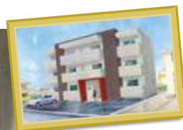
M様マンション 三重県四日市市 東富田町 32-14付近