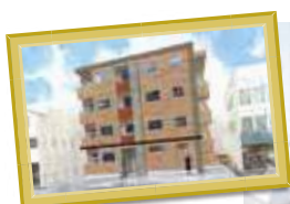
M様マンション 愛知県名古屋市 緑区鳴海町宿地 24番地付近

ゴールドトラスト土地活用事業部では、『すべては幸せな住まいから』をコンセプトにマンション・サ高住を土地探しから、デザイン・施工～アフターフォローまで行っております。入居者様の満足を基準にこだわりご成約頂いた物件の中で、現在建築中の建物をご紹介します。お近くへ行かれる際には是非足をお運びください。