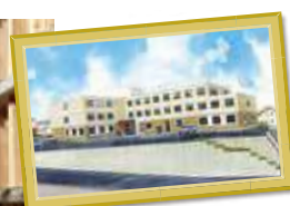
K様サ高住 愛知県碧南市 山神町一丁目47