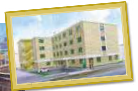
S様サ高住 愛知県名古屋市長 緑区浦里 五丁目115