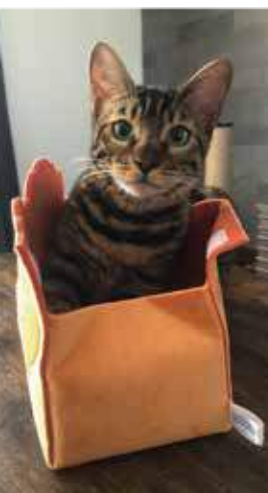
◀ベンガルの“月見ちゃん”

今年の1月に猫を飼い始めました。生後間もない子猫で、すごく甘えん坊です。朝になるとお腹が空くのか、いつも起こしにきてくれます。おかげで目覚ましのスヌーズ機能が必要なくなりました。帰宅時は、すぐさまべったりとくっついてくるので、毎日癒やされています。