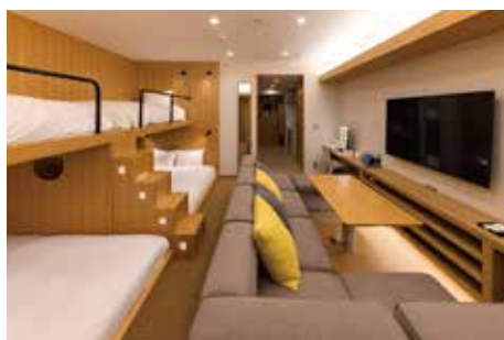
Deluxe Room デラックスルーム

名古屋の街に住まうように泊まるアパートメントホテル。 各室キッチン完備で1フロア(3室)利用で最大13名までお泊まりいただけます。