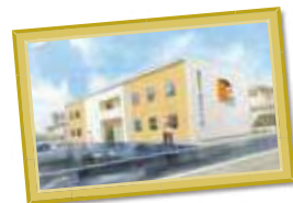
S様日中支援型グループホーム 三重県桑名市額田106付近