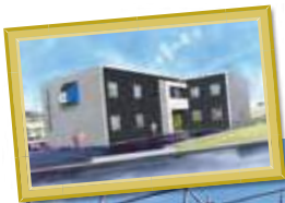
T様日中支援型グループホーム 三重県津市藤方1961-1