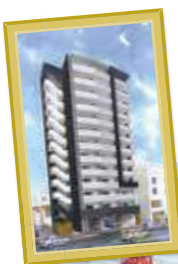
分譲マンション 愛知県名古屋市 西区則武新町 三丁目8-8