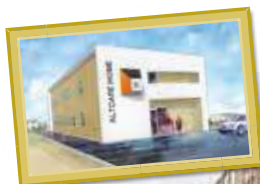
S様日中支援型グループホーム 岐阜県岐阜市西河渡三丁目付近

ゴールドトラスト土地活用事業部では、『すべては幸せな住まいから』をコンセプトにマンション・サ高住を土地探しから、デザイン・施工～アフターフォローまで行っております。入居者様の満足を基準にこだわりご成約頂いた物件の中で、現在建築中の建物をご紹介します。お近くへ行かれる際には是非足をお運びください。