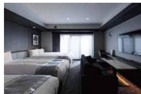
ReFa Room ReFaルーム