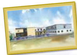
A様サ高住 岐阜県羽島郡笠松町長池584付近