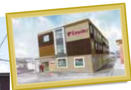
S様有料老人ホーム 三重県四日市市 下さざらい町11-8