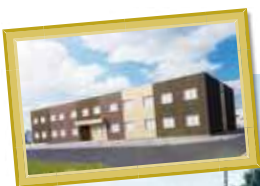
K様サ高住 岐阜県羽島市正木町曲利8-1付近