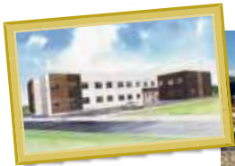
W様サ高住 岐阜県可児市 瀬田竹腰465