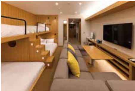
Deluxe Room デラックスルーム