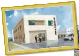
B様日中支援型 グループホーム 三重県津市 木戸町東出 7130付近