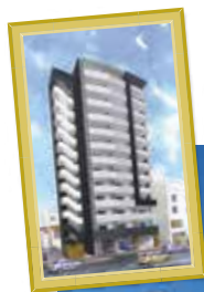
分譲マンション 愛知県名古屋市中区則武新町三丁目8-8

ゴールドトラスト土地活用事業部では、『すべては幸せな住まいから』をコンセプトにマンション・サ高住を土地探しから、デザイン・施工～アフターフォローまで行っております。入居者様の満足を基準にこだわりご成約頂いた物件の中で、現在建築中の建物をご紹介します。お近くへ行かれる際には是非足をお運びください。