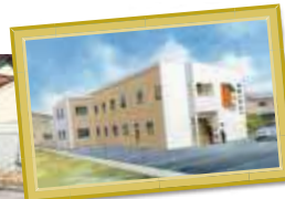
A様日中支援型 グループホーム 岐阜県岐阜市 茜部野瀬1丁目52