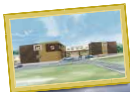
K様サ高住 三重県三重郡菟野町菟野2713-1付近