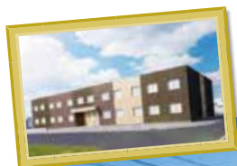
K様サ高住 岐阜県羽島市正木町曲利8-1付近