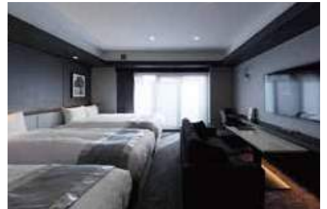
ReFa Room ReFaルーム