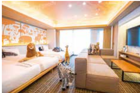
Culture Room カルチャールーム