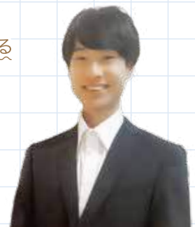
スマイシア賃貸 後藤

月に1～2回程度のお手入れが目安です。でんぷん質が蓄積することで、 逆に汚れが付きやすくなる可能性があるため、注意が必要です。 ワックスほどの持続性はありませんが、「化学的なワックスを避けたい」「自然な方法で床を綺麗にしたい」という方には、お米のとぎ汁は手軽でおすすめな方法です！